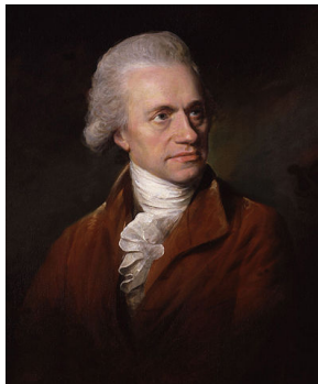
William Herschel (1738–1822)

*Instytut Matematyki Stosowanej i Mechaniki UW ** Wydział MIM UW