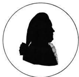
Anders Johan Lexell (1740–1784)

Nasz amator stał się w jednej chwili sławny w całym naukowym świecie i w 1782 roku miał swoje ostatnie wystąpienie muzyczne. A muzykiem był znakomitym. Jego symfonie i koncerty są również dziś wykonywane i nagrywane (nie trudno je odszukać w serwisie YouTube). Fascynującą historię muzycznej i astronomicznej rodziny Williama Herschela, w tym jego siostry, Karoliny Herschel – pierwszej kobiety na królewskiej posadzie astronoma (z pensją 50 funtów rocznie), oraz syna, Johna Herschela – wybitnego uczonego i kontynuatora astronomicznego dzieła ojca, można znaleźć w [Holmes] (patrz też [Lemonick], [Hoskin], [Lubbock]).