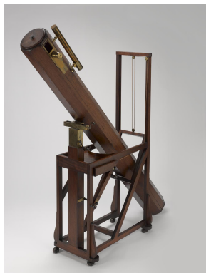
2,1-metrowy (7-stopowy) reflektor Herschela.