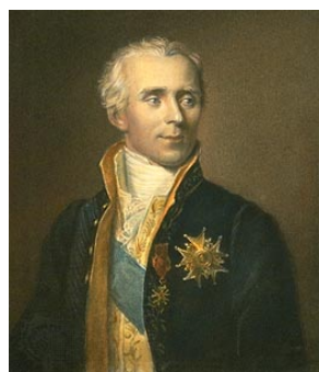
Pierre-Simon Laplace (1749–1827)