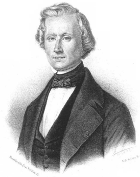
Urbain Jean Joseph Le Verrier (1811–1877)

Wyjaśnienie to byłoby jednak uderzeniem w sam fundament obrazu świata i ta hipoteza po rozważaniach została w końcu zarzucona. Łatwiejszym do przyjęcia było ostatecznie logiczne wyjaśnienie: istnienie nieznanej dotąd planety zaburzającej ruch Urana.