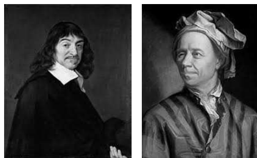
Kartezjusz & Leonhard Euler

Dowiadujemy się z nich, że słynne twierdzenie o wielościanach Eulera znane było Kartezjuszowi. Obecnie można już się spotkać z twierdzeniem Eulera–Kartezjusza lub wręcz po prostu Kartezjusza o wielościanach . Warto tu zwrócić uwagę, w kontekście oskarżeń wysuwanych pod adresem Hooke'a, że ani Kartezjusz, ani Euler nie udowodnili twierdzenia, a pomimo to ich pionierska rola doceniona została w nomenklaturze.