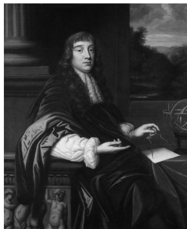
Portrait of a Mathematician (około 1680 r.), autorstwa Mary Beale, jest jedynym portretem przedstawiającym (prawdopodobnie) Roberta Hooke'a

* Wydział Matematyki, Informatyki i Mechaniki, Uniwersytet Warszawski