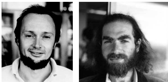
Richard Hamilton & Grigoriy Perelman

G. Perelman, 1 czerwca 2010 r., cytowanie za agencją Interfax.