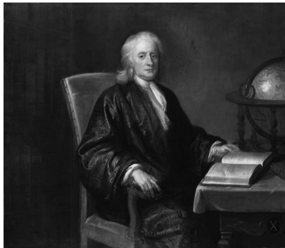
Isaac Newton ok. 1726 roku, u schyłku życia

ów list był decydujący w obraniu przez Newtona nowego kursu w swoich rozważaniach. Jego koncepcje dotyczące teorii grawitacji przed rokiem 1684 były mieszaniną teorii wirów Kartezjusza i sił magnetycznych, co przedstawił w pracach na temat komety z przełomu lat 1680–1681, o której doniósł Newtonowi Królewski Astronom Flamsteed.