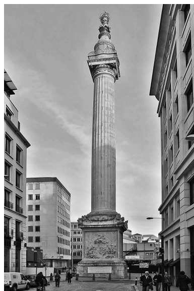
Charakterystyczny The Monument to the Great Fire of London jest pamiątką po tragicznym pożarze Londynu i instrumentem naukowym jednocześnie

Grzegorz ŁUKASZEWICZ*, Mikołaj SIERŻĘGA*