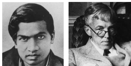
Srinivasa Ramanujan & Godfrey H. Hardy

G. H. Hardy, cytowanie za R. Kanigel str. 363.