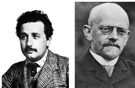
Albert Einstein & David Hilbert