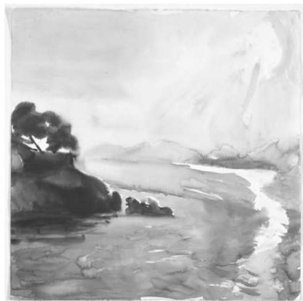
Rys. 3. Zachód słońca namalowany przez P. Tetsisa w dniach różniących się głębokością optyczną atmosfery. Źródło: [4]

Kolorowe wersje ilustracji na stronie deltami.edu.pl .