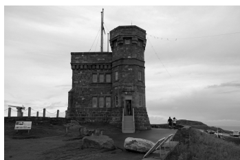
Cabot Tower w miejscowości St. John's, Kanada (plik image.jpg ).

Więcej o sieci Inception: arxiv.org/abs/1512.00567 oraz ai.googleblog.com/2016/03/train-your-own-image-classifier-with.html