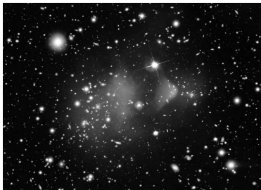
Układ gromad galaktyk Pocisk.

Model LCDM przewiduje, że Kosmos w około ćwierci swojej masy składa się z grawitującej, acz nieświecącej ciemnej materii, a 70% przypada na ciemną energię, czyli kosmiczny dziwoląg zapewniający paliwo do wciąż przyspieszającej ekspansji czasoprzestrzeni. W końcu, pozostałe 5% tego, co istnieje, to tzw. materia barionowa, czyli znane nam na co dzień atomy (głównie wodór i hel), fotony i cała menażeria standardowego modelu cząstek elementarnych.