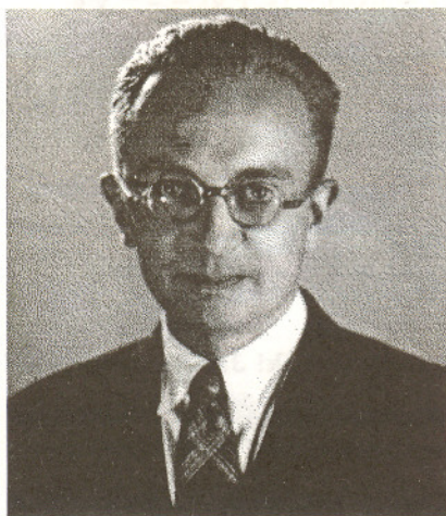
Bolesław Iwaszkiewicz (1902–1989)