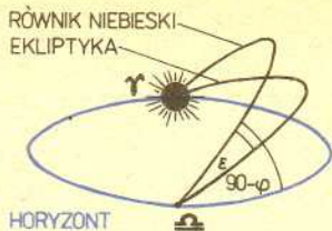
Rys. 2. W czasie równonocy wiosennej, w momencie wschodu Słońca, ekliptyka tworzy najmniejszy kąt z horyzontem.