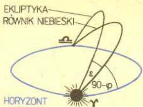
Rys. 1. W czasie równonocy wiosennej, w momencie zachodu Słońca, ekliptyka tworzy największy kąt z horyzontem.